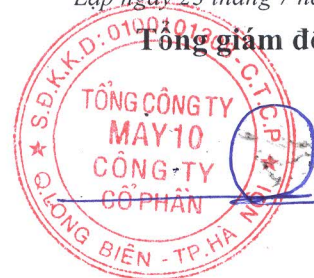
Thân Đức Việt